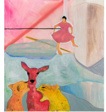
Untitled 무제 2023 oil, acrylic, epoxy resin on canvas 캔버스에 유채, 아크릴릭, 에폭시 레진 115 x 100 cm