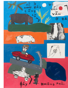
Speeding car on CA-HW1 cascades into concrete barrier, and Hippopotamus unknowingly wades in front of waterfall

자유의 모호함 2022 oil, charcoal, pencil on canvas 캔버스에 유채, 목탄, 연필 90 x 70.5 cm