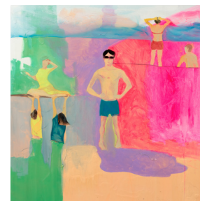
Untitled 무제 2022 oil, acrylic, acrylic resin on canvas 캔버스에 유채, 아크릴릭, 아크릴릭 레진 115 x 115 cm