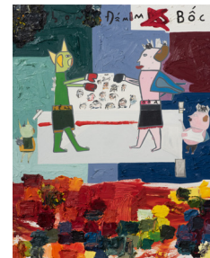
Prizefight from Downunder

이미 벌어졌다. 막을 수 없다 2020 oil on canvas 캔버스에 유채 130 x 130 cm