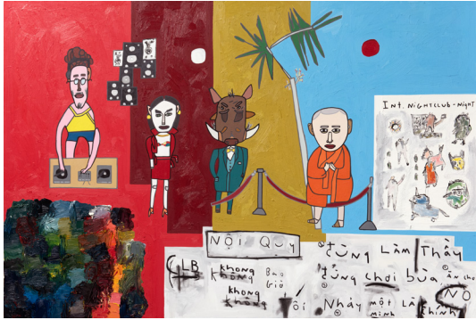
Red leather, Warthogs, and Wandering Monks past Midnight