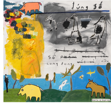
Arriving on Fate