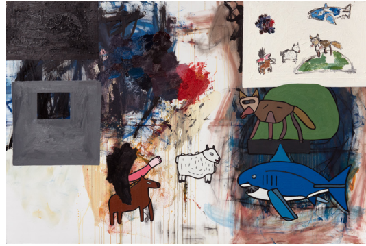
The Association of Wild Rabid Animals