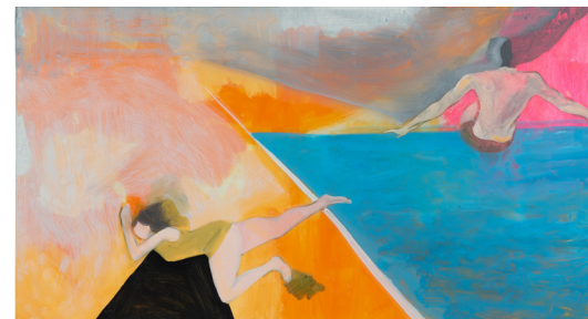
Untitled 무제 2022 oil, acrylic, epoxy resin on canvas 캔버스에 유채, 아크릴릭, 에폭시 레진 70 x 130 cm