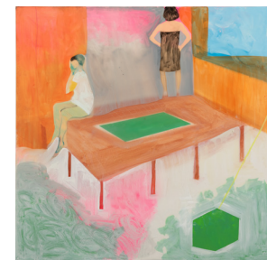
Untitled 무제 2022 oil, acrylic, epoxy resin on canvas 캔버스에 유채, 아크릴릭, 에폭시 레진 115 x 115 cm