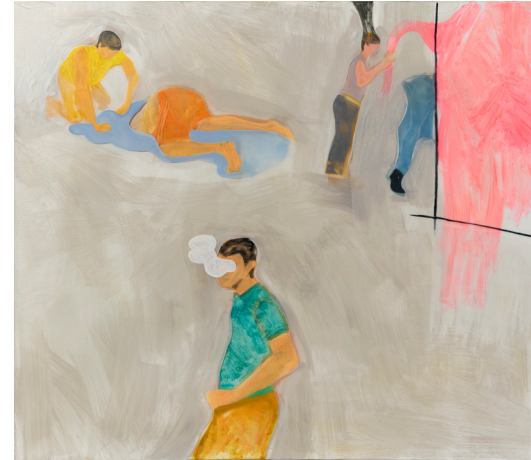
Untitled 무제 2023 oil, acrylic, epoxy on canvas 캔버스에 유채, 아크릴릭, 에폭시 100 x 115.5 cm

또한, 도는 Spot Art Singapore 2014 (ARtrium @ MCI, Singapore)에 참여했으며, 하노이 Heritage Space에서 브라운 무브먼트 레지던시 프로그램을 진행한 바 있습니다. 도는 하노이와 호치민을 오가며 생활하고 작업하고 있습니다.